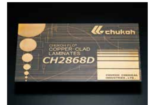
Copper-clad laminates / แผงวงจรลามิเนตหุ้มทองแดง

Fluoroplastic coating achieving world-class quality and quantity. การเคลือบฟลูออโรพลาสติกที่ประสบความสำเร็จทั้งในด้านคุณภาพและขนาดระดับแนวหน้าของโลก