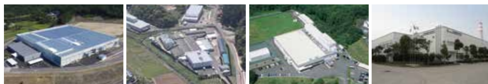
F1 Matsuura Factory (Japan) Matsuura Factory (Japan) Utsunomiya Factory (Japan) China Factory (Chukoh Chemical Fluorine Plastic Changshu Co.,Ltd.)