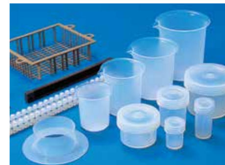
Injection molding products / ผลิตภัณฑ์ฉีดขึ้นรูป