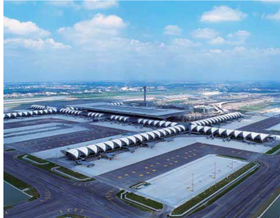
Skytop / แผ่นเมมเบรนฟลูออโรพลาสติก