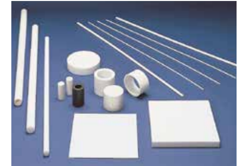
PTFE manufacturing material / วัสดุที่ผลิตจากPTFE