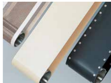
Non-adhesive belts / สายพาน