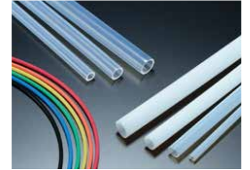
Tube, Hose / ท่อ, ท่อ