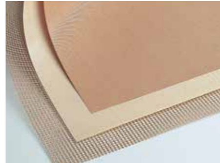
Fluoroplastic fabric / ผ้าเคลือบฟลูออโรพลาสติก

บริษัทจูโค เคมิคัล (ประเทศไทย) จำกัด ดำเนินธุรกิจเป็นตัวแทนจัดจำหน่ายผลิตภัณฑ์ฟลูออโรพลาสติกในประเทศไทย และเป็นบริษัทในเครือของบริษัท จูโค เคมิคัล อินดัสตรีส์ ลิมิเต็ด ซึ่งเป็นผู้ผลิตผลิตภัณฑ์ฟลูออโรพลาสติกชั้นนำในประเทศญี่ปุ่น ฟลูออโรพลาสติกเป็นพลาสติกที่มีคุณสมบัติเฉพาะที่ยอดเยี่ยมอย่างการทนต่อความร้อน ไม่เกาะติดผิว และทนต่อสารเคมี เราจึงสามารถนำผลิตภัณฑ์ไปใช้ได้หลากหลายอุตสาหกรรมไม่ว่าจะเป็นอุตสาหกรรมเคมีคอนกรีต, รถยนต์, อาหาร, การสื่อสาร, การแพทย์ และอื่นๆ บริษัท จูโค เคมิคัล อินดัสตรีส์ ลิมิเต็ด ซึ่งเป็นผู้ผลิตของเรานั้นมีเทคโนโลยีการแปรรูปฟลูออโรพลาสติกที่โดดเด่น โดยเฉพาะอย่างยิ่งเทคโนโลยีการเคลือบผ้าที่ใช้ในงานอุตสาหกรรมอย่างงานเคลือบผ้าใยแก้ว ด้วยสารฟลูออโรเรซิน ซึ่งเป็นเทคโนโลยีที่มีชื่อเสียงในระดับโลก และเนื่องจากบริษัทของเราเป็นตัวแทนจัดจำหน่ายโดยตรงกับบริษัทผู้ผลิต เราจึงสามารถตอบสนองความต้องการที่หลากหลายของลูกค้าได้ ไม่ใช่แค่ในส่วนผลิตภัณฑ์สำเร็จรูป แต่รวมถึงผลิตภัณฑ์ผลิตตามสั่ง และผลิตภัณฑ์ตัวอย่าง