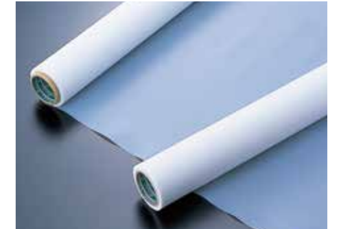
PTFE processing material / วัสดุแปรรูป PTFE