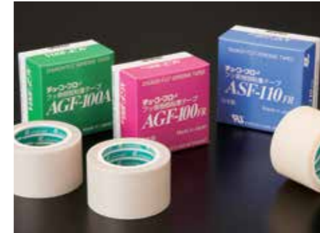
Adhesive tape / เทปกา