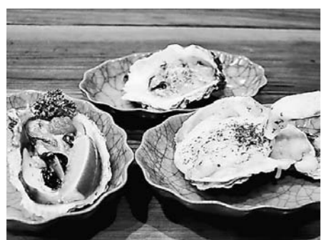
岩牡蠣のグラタン風